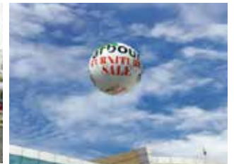
Balloon (size 3m)