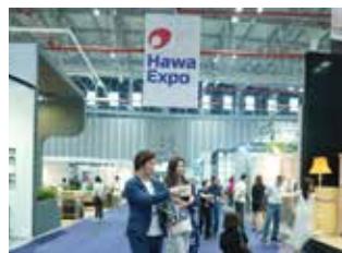
Indoor Banner 3x5m