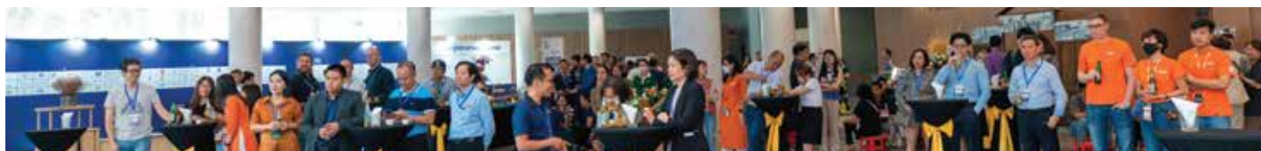
Event Center Lobby