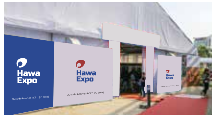
Outside banner C area (4mx3m)