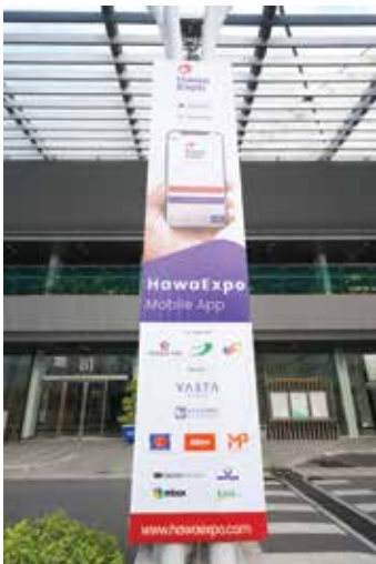
Outdoor Banner 1x5m