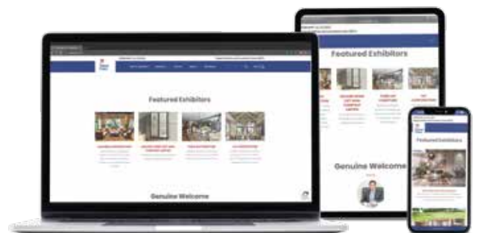
Advertisement package on website and app